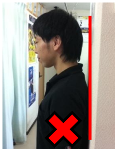
頭が壁につかない