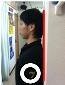
頭が壁にきっちりつく