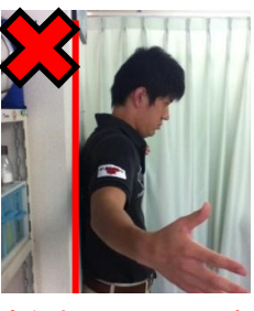
腕を水平に開いた時、頭と腕の両方、またはどちらかが壁から離れる