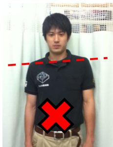
右肩が下がっている