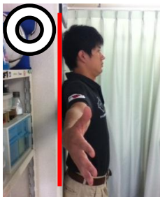
腕を水平に開いた時 頭と腕が壁につく